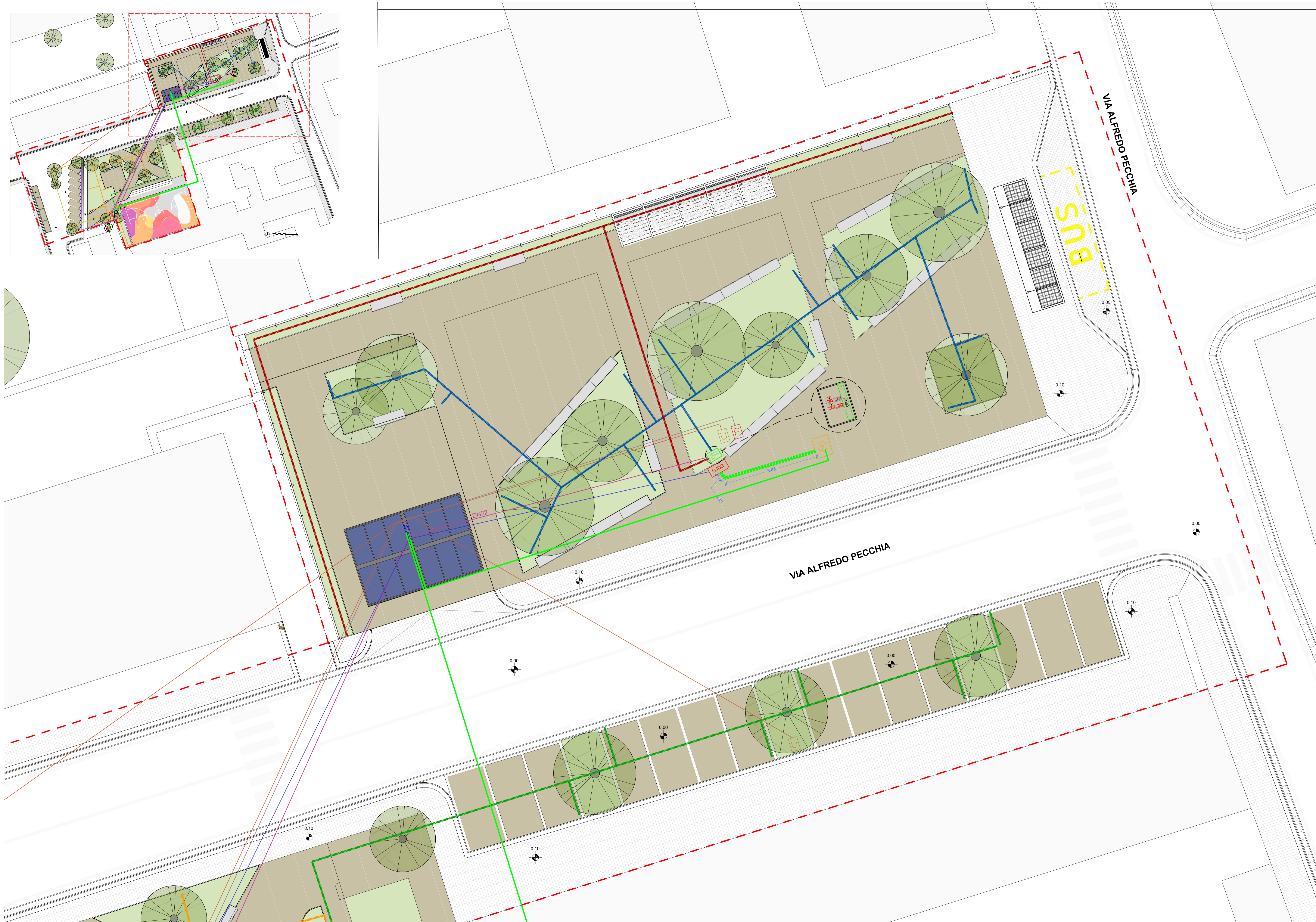
Stralcio planimetrico - scala 1:100